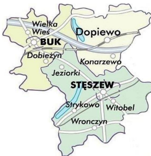
Mapa 1 - Obszary administracyjne gmin wchodzących w skład Stowarzyszenia LGD „Źródło”